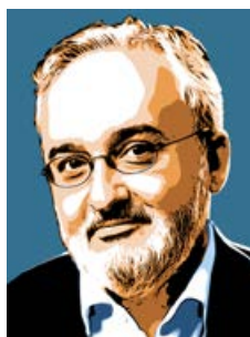
Rodrigo Assumpção Presidente da Dataprev